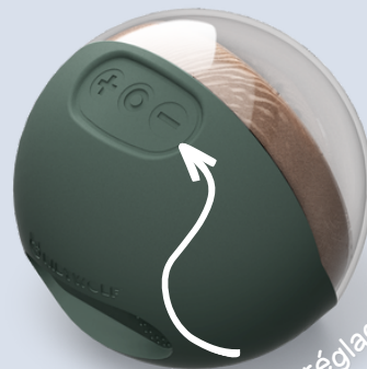
Barre de réglages